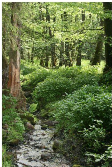
strumień drążący kopułę olsu źródliskowego

Olsy źródliskowe najczęściej objęte są ochroną zachowawczą tzn. bierną. W Parku Krajobrazowym „Dolina Stupi” podjęto próbę ochrony czynnej kopuły olsu źródliskowego w Rezerwacie Przyrody „Źródliskowe Torfowisko”. Budowa dwóch wzmocnionych zastawek piętrzących ograniczyła erozję złoża torfowego poprzez spowolnienie spływu powierzchniowego wód z kopuły.