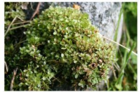
merzyk kropkowany Rhizomnium punctatum

W licznie spływających z kopuły olszyny źródliskowej strumykach na kamieniach, gałęziach czy na samym torfie w najniższej warstwie - mszystej można spotkać rzadkie gatunki mszaków źródliskowych i wątrobowców.