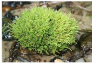
krótkosz strumieniowy Brachythecium rivulare