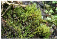
zębrowiec wapienny Cratoneuron comutatum

W licznie spływających z kopuły olszyny źródliskowej strumykach na kamieniach, gałęziach czy na samym torfie w najniższej warstwie - mszystej można spotkać rzadkie gatunki mszaków źródliskowych i wątrobowców.