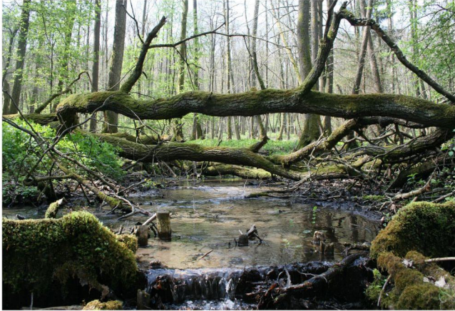
zastawka spowalniająca odpływ wody z Rezerwatu Przyrody "Źródliskowe Torfowisko"

Olsy źródliskowe najczęściej objęte są ochroną zachowawczą tzn. bierną. W Parku Krajobrazowym „Dolina Stupi” podjęto próbę ochrony czynnej kopuły olsu źródliskowego w Rezerwacie Przyrody „Źródliskowe Torfowisko”. Budowa dwóch wzmocnionych zastawek piętrzących ograniczyła erozję złoża torfowego poprzez spowolnienie spływu powierzchniowego wód z kopuły.