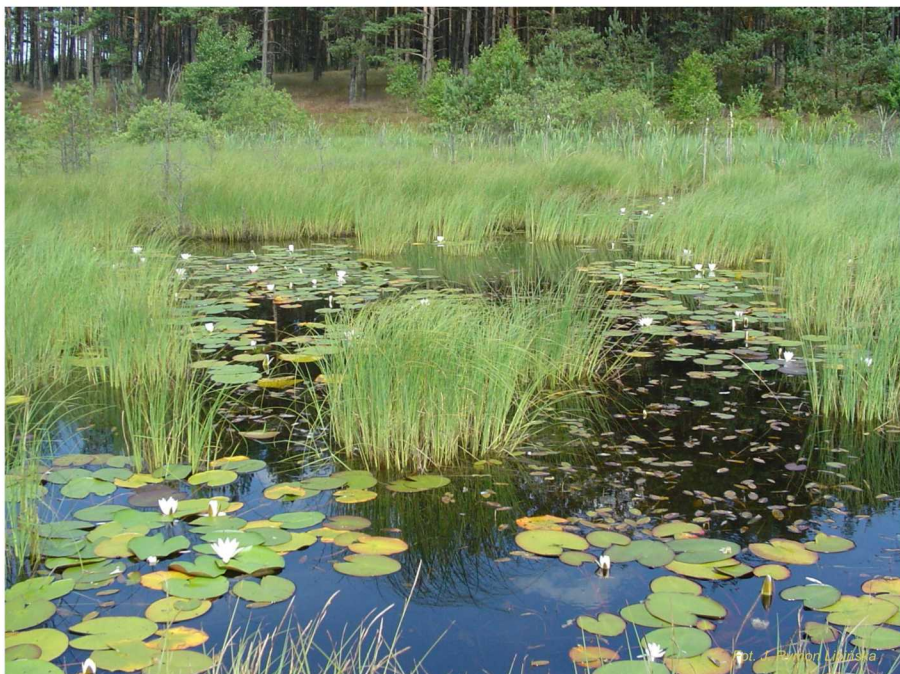
Dzięki bogactwu szaty roślinnej jeziora eutroficzne stwarzają wiele nisz ekologicznych dla licznych gatunków zwierząt