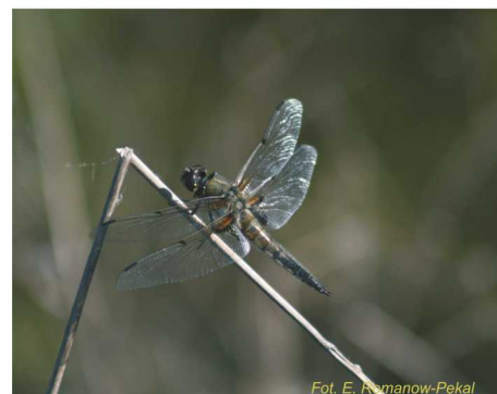
Ważka czteroplama Libellula quadrimaculata