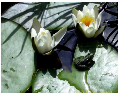
Żaba wodna Pelophylax kl. esculentus na liściu grzybeni białych