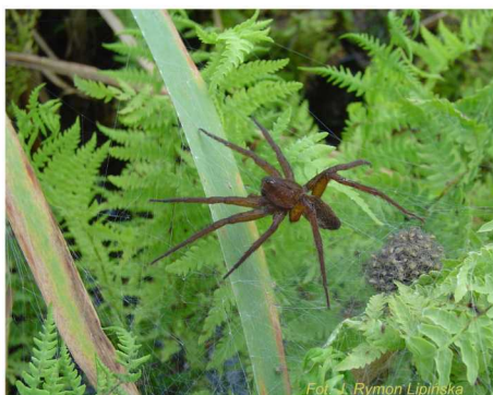
Samica bagnika Dolomedes plantarius przy gnieździe