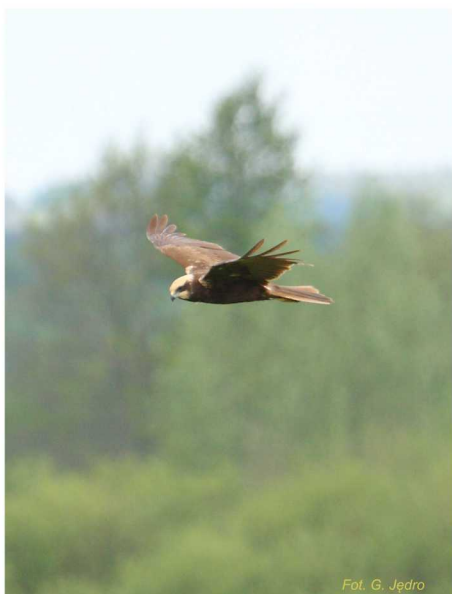
Błotniak stawowy Circus aeruginosus

Jeziora eutroficzne są siedliskiem występowania wielu gatunków zwierząt. W szerokim pasie szuwarów gnieźdzą się liczne ptaki, takie jak: wąsatka, łyska i błotniak stawowy. Bogata roślinność wodna sprzyja występowaniu płazów i bezkręgowców wodnych. W typologii rybackiej jeziora eutroficzne to jeziora leszczowe, linowoszczupakowe lub sandaczowe.