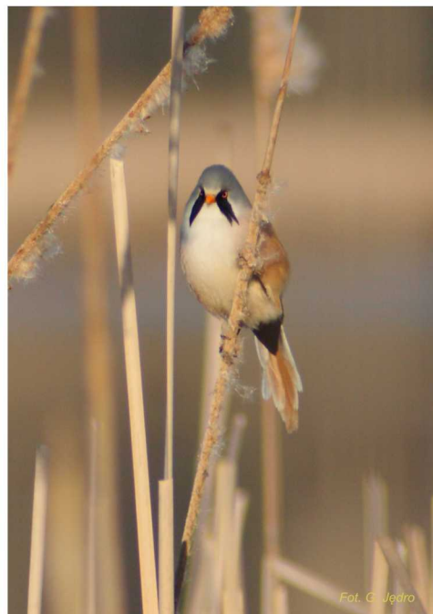
Wąsatka Panurus biarmicus

Jeziora eutroficzne są siedliskiem występowania wielu gatunków zwierząt. W szerokim pasie szuwarów gnieźdzą się liczne ptaki, takie jak: wąsatka, łyska i błotniak stawowy. Bogata roślinność wodna sprzyja występowaniu płazów i bezkręgowców wodnych. W typologii rybackiej jeziora eutroficzne to jeziora leszczowe, linowoszczupakowe lub sandaczowe.